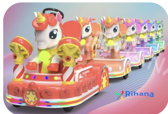
Тип: Поезд "Животные"

Вагоны: 1+5 Размер локомотива: 1.92m*1.17m*1.42m Размер вагона: 1.78m*1.1m*1.1m Аккумулятор: 48v150A Время работы после зарядки: 8 часов Мощность: 3 кВт Вместимость: 1 + 2человек в каждом вагоне Вес поезда: 1.2 т.