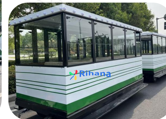
Тип: Поезд на 42 человек

Вагоны: 1+2 Размер локомотива: 4.07m*1.7m*2.2m Размер вагона: 3.85m*2.06m*2.52m Аккумулятор: 12шт*6v200A / Бензиновые! Время работы после зарядки: 8 часов Мощность: 7.5кВт. Вместимость: 2 + 20 человек в каждом вагоне