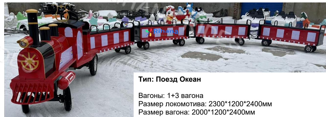
Тип: Поезд Океан

Вагоны: 1+3 вагона Размер локомотива: 2300*1200*2400мм Размер вагона: 2000*1200*2400мм Аккумулятор: 5шт*12v150А Тормозная система: гидравлический тормоз Время работы после зарядки: 8 часов Мощность: 3 кВт