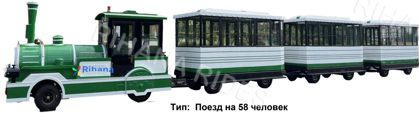
Тип: Поезд на 58 человек

Вагоны: 1+2 Размер локомотива: 4.07m*1.7m*2.2m Размер вагона: 5.14m*2.17m*2.52m Аккумулятор: аккумуляторные / Бензиновые! Время работы после зарядки: 8 часов Вместимость: 2 + 28 человек в каждом вагоне