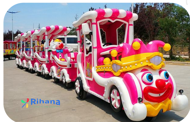
Тип: Поезд "Клоун"

Вагоны: 1+3 вагона Размер локомотива: 3.1*1.1*2.2m Размер вагона: 1.6*0.95*1.8m Вместимость: 17 взрослых или 24 детей Мощность: 3кВт Напряжение: 380В