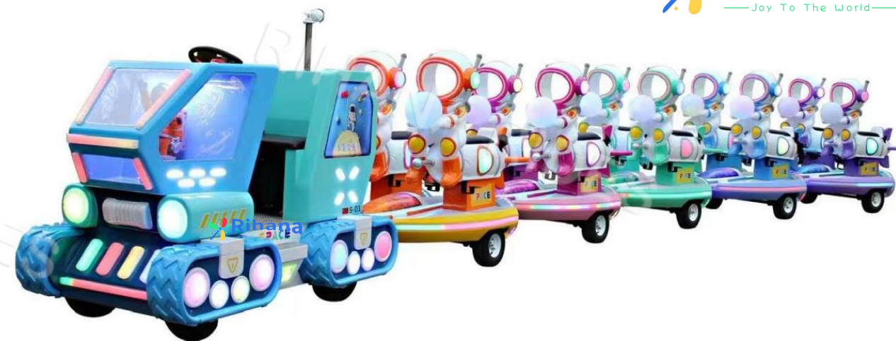
Тип: Поезд “Астронавт”

Вагоны: 1+5 Размер локомотива: 1.92m*1.17m*1.42m Размер вагона: 1.78m*1.1m*1.1m Аккумулятор: 48v150A Время работы после зарядки: 8 часов Мощность: 3 кВт Вместимость: 1 + 2человек в каждом вагоне Вес поезда: 1.2 т.