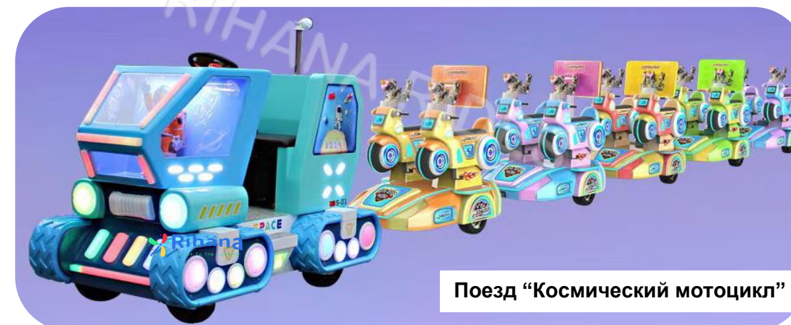
Поезд “Космический мотоцикл”