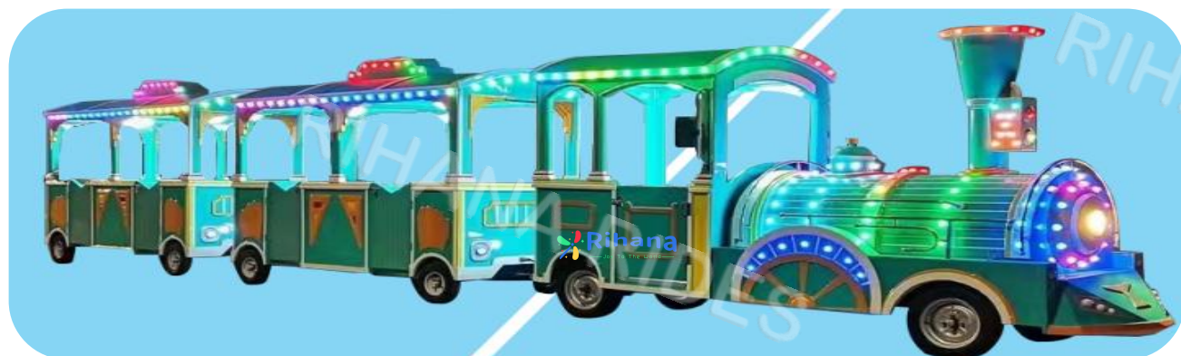
Тип: Поезд на 12 человек / вагон

Вагоны: 1+2 Размер локомотива: 3.9m*1.2m*2.25m Размер вагона: 3m*1.2m*2.45m Аккумулятор: 10шт*6v200A Время работы после зарядки: 8 часов Мощность: 7.5кВт. Вместимость: 12 человек в каждом вагоне*2