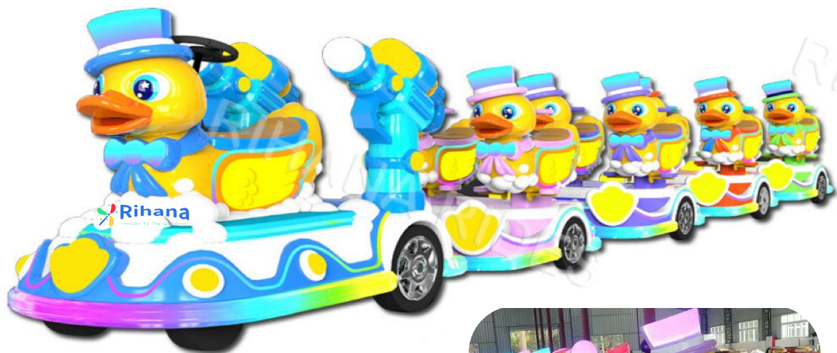
Тип: Поезд “Животные”

Вагоны: 1+5 Размер локомотива: 1.92m*1.17m*1.42m Размер вагона: 1.78m*1.1m*1.1m Аккумулятор: 48v150A Время работы после зарядки: 8 часов Мощность: 3 кВт Вместимость: 1 + 2человек в каждом вагоне Вес поезда: 1.2 т.