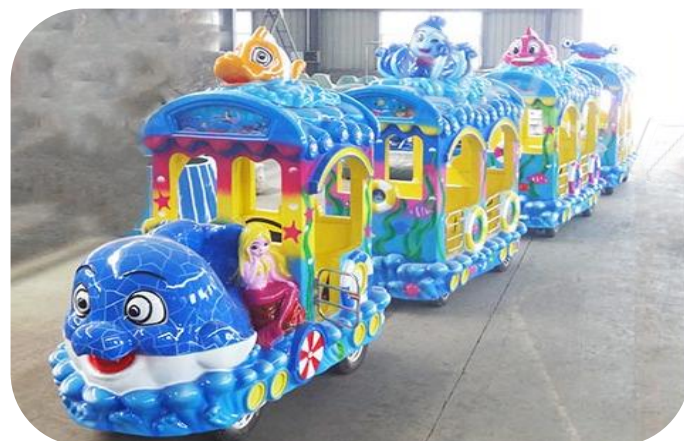
Тип: Поезд Океан

Вагоны: 1+3 вагона Размер локомотива: 2300*1200*2400мм Размер вагона: 2000*1200*2400мм Аккумулятор: 5шт*12v150А Тормозная система: гидравлический тормоз Время работы после зарядки: 8 часов Мощность: 3 кВт