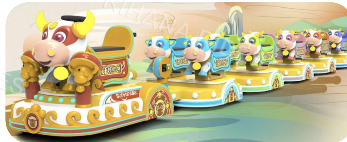
Тип: Поезд "Храбрая корова"