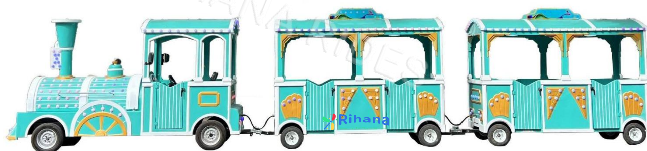
Тип: Поезд на 27 человек

Вагоны: 1+3 Размер локомотива: 3.4m*1.75m*2.25m Размер вагона: 2.35m*1.45m*2.25m Аккумулятор: 12шт*6v200A Время работы после зарядки: 8 часов Мощность: 7.5кВт. Вместимость: 1 + 9 человек в каждом вагоне