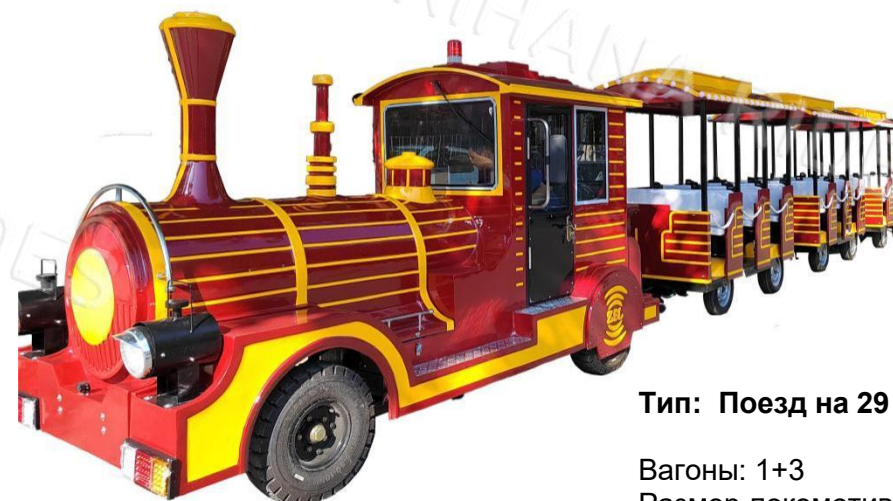
Тип: Поезд на 29 человек

Вагоны: 1+3 Размер локомотива: 4.07m*1.7m*2.2m Размер вагона: 2.35m*1.45m*2.25m Аккумулятор: 12шт*6v200A Время работы после зарядки: 8 часов Мощность: 7.5кВт. Вместимость: 2 + 9 человек в каждом вагоне