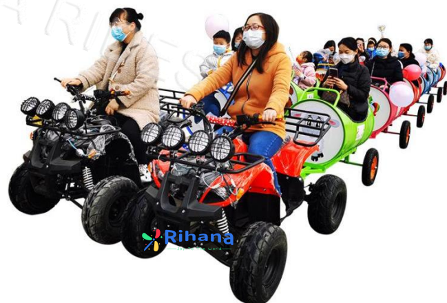
Тип: Поезд "Нефтяной баррель"

Вагоны: 1+6 вагона Размер локомотив: 150*94*98cm Размер вагона: 90*58*98m Вместимость: 7 человек Мотор:60V1000W Аккумулятор: 20A*5