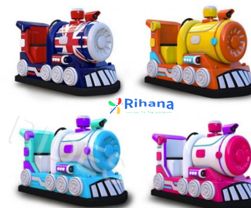
Тип: маленький поезд тук-тук

Вагоны: 1+2 вагона Размер локомотив: 2620*1110*1560мм Размер вагона: 2540*950*1060мм Вместимость: 1+ 6*2 человек Мощность: 3KW Аккумулятор: 4шт*12V100A